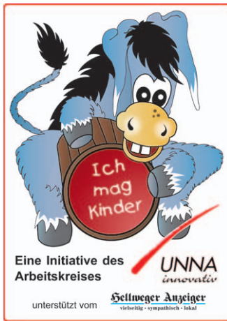
Eine Initiative des Arbeitskreises UNNA innovativ. Unterstützt vom Seltweger Anzeiger. unterst. v. UNNA innovativ. Seltweger Anzeiger. unterst. v. UNNA innovativ. Seltweger Anzeiger.

Steinwegs Hauptdiagnosewerkzeug sind seine sensiblen Hände, mit denen er Erkrankungen der Knochen buchstäblich begreift und so