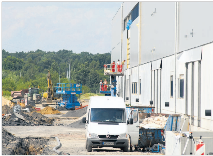
Neue Großarbeitgeber braucht die Stadt. Zurzeit richten sich die Hoffnungen auf den zweiten DHL-Standort in Königsborn, der künftig für 350 Stellen gut sein dürfte.