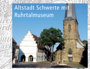
Altstadt Schwerte mit Ruhrtalmuseum

Empfohlenes Infomaterial: Radwanderkarte „Östliches Ruhrgebiet“, die Tourismusbroschüre und die TouristMap des Kreises Unna. Weitere Infos und gps-tracks unter: www.fahrradbus.kreis-unna.de