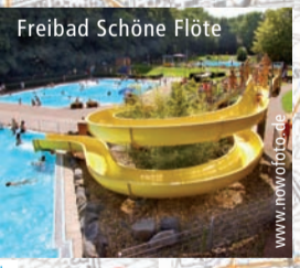
Freibad Schöne Flöte