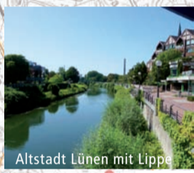
Altstadt Lünen mit Lippe