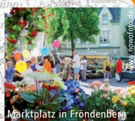
Marktplatz in Fröndenberg