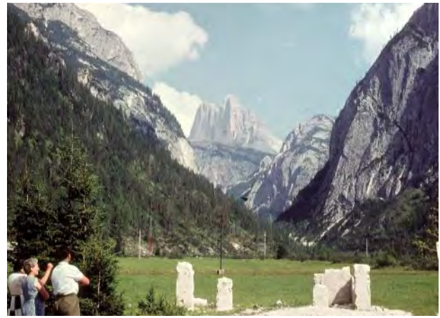
Bei Cortina d'Ampezzo