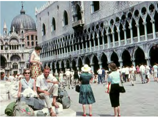
Auf dem Marcus-Platz in Venedig