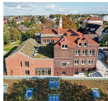
› Die Dachbegrünung auf dem Erweiterungsbau der Schillerschule in Massen.

Die Kreisstadt Unna freut sich über den dritten Platz in einem Architektur-Wettbewerb: Die Erweiterung der Schillerschule in Massen, geplant von dem Architekturbüro Lindner Lohse Architekten und umgesetzt in enger Zusammenarbeit mit dem städtischen Immobilienmanagement, belegte Rang 3 im “Flachdach Contest 2025“ des Fachverbandes “Der dichte Bau“. Bei diesem Projekt wurde das Schulgebäude durch einen Anbau um Räume für den offenen Ganzttag ergänzt. Weiterhin wurde auf dem Gelände die zweigeschossige Kindertagesstätte “Schillermöwen“ errichtet. Die Eröffnung erfolgte im Jahr 2024. “Architektonisch prägend“, so die Begründung der Jury, sei das Motiv des genutzten Flachdaches in Verbindung mit einem begrünten Satteldach. “Durch die Verbindung der flachen und der geneigten Gründächer entsteht eine harmonische Dachlandschaft, die Bestand und Neubau zu einem stimmigen Gesamtkonzept vereint. Die Einbindung der Dachlandschaft in das räumliche Gefüge – visuell wie funktional – zeugt von einer durchdachten Planung“, lobt die Jury. ■ KEK