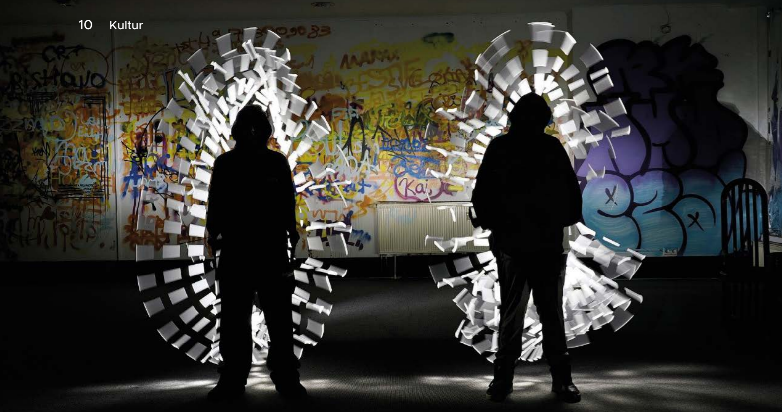
› Das Jugendcafé Chili experimentiert beim Lightpainting mit dem Künstler Manuel Köstler.