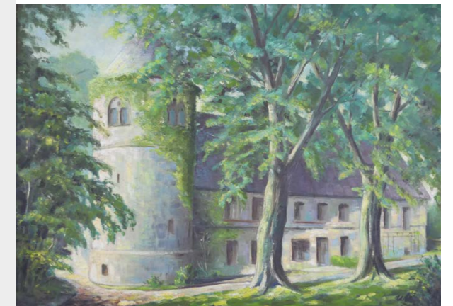
► Dieses Ölgemälde trägt den Titel "Burg Unna" und wurde in den 1950er-Jahren von Wilhelm Meinecke gemalt. 2024 fand es in Folge einer Schenkung Eingang in die Sammlung des Hellweg-Museums.

musste. Verbesserung oder Verschlechterung? Das lag schon immer im Auge des Betrachters. "Die Ausstellung soll durchaus auch zum Nachdenken und Diskutieren anregen", so Dr. Olmer. Insgesamt haben die Kuratorinnen Dr. Tina Ebbing und Kathrin Göttker MA rund 80 Stadtansichten zusammengestellt, anhand derer die Besucherinnen und Besucher nachvollziehen können, wie bauliche Entwicklung, Bildproduktion und öffentliche Debatte miteinander verflochten sind – und wie sich Stadtbild und Stadtgedächtnis gegenseitig formen. Zwölf aktuelle Fotografien von Mitgliedern des Foto-Club Unna e.V. ergänzen die Objekte aus der Museumssammlung. Die Ausstellung "Unna 2D – Ansichten einer Stadt" ist vom 1. März bis zum 30. August im Hellweg-Museum zu sehen. ■ KEK